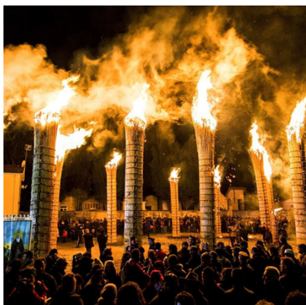
Da: Strada dei parchi

FESTA DEL SANTO PATRONO: OGNI PAESE HA IL SUO SANTO E IL GIORNO DI FESTE